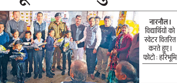
नारनौल। विद्यार्थियों को स्वेटर वितरित करते हुए।

अग्रवाल वैश्य समाज जिला इकाई की ओर से स्थापना दिवस पर सोमवार को सामाजिक एवं मानवसेवा कार्यक्रम का आयोजन किया गया। कार्यक्रम के अंतर्गत जरूरतमंद व आर्थिक रूप से कमजोर वर्ग के विद्यार्थियों व परिवारों को निःशुल्क स्वेटर, जूते, जुराब व खाद्य सामग्री वितरित की गई। कार्यक्रम का आयोजन राजकीय