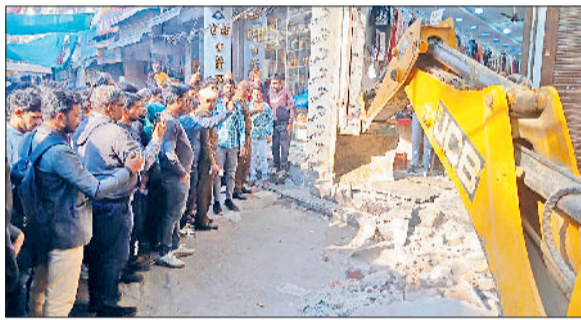
भिवानी। दुकान से बाहर बनाए चबूतरे को तोड़ती जेसीबी और दुकानदारों में मची अफरातफरी।