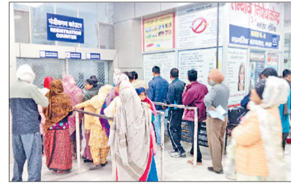
नारनौल। नागरिक अस्पताल के काउंटर पर रजिस्ट्रेशन कराते मरीज। एक्स-रे रूम के बाहर खड़े मरीज।

गौर हो कि एचसीएमएसए ने अपनी मांगों को लेकर 8 व 9 दिसंबर की दो दिवसीय हड़ताल की पहले से घोषणा की थी। इस हड़ताल में एसोसिएशन से जुड़े