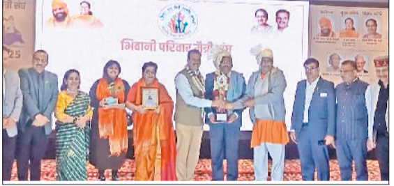
बहल। आयोजित कार्यक्रम में सम्मानित करते हुए।