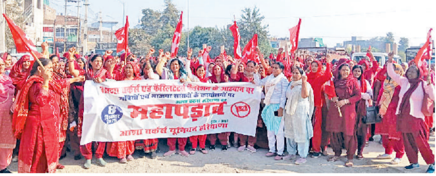
भिवानी। मांगों को लेकर शहर में जुलूस निकालती आशा वर्कर्स।