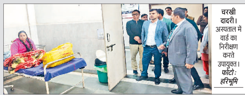
चरखी दादरी। अस्पताल में वार्ड का निरीक्षण करते उपायुक्त।

उपायुक्त डॉ. मुनीश नागपाल ने सोमवार को शहर के नागरिक अस्पताल का निरीक्षण किया और डॉक्टरों की हड़ताल के कारण अस्पताल में चिकित्सा सेवाओं की स्थिति का जायजा लिया। डॉ.सी ने अस्पताल परिसर में पहुंचकर मरीजों से बातचीत की और उन्हें उपलब्ध कराई जा रही स्वास्थ्य सेवाओं का फीडबैक लिया। निरीक्षण के दौरान उपायुक्त ने मरीजों को सुचारू सुविधाएं उपलब्ध करवाने संबंधी निर्देश भी अधिकारियों को दिए। निरीक्षण के दौरान आपातकालीन कक्ष, ओपीडी, लेबर रूम तथा सर्जरी वार्ड की व्यवस्थाओं की समीक्षा की गई। उपायुक्त ने कहा कि आम लोगों को किसी प्रकार की परेशानी न हो, यह जिला प्रशासन की प्राथमिकता है।