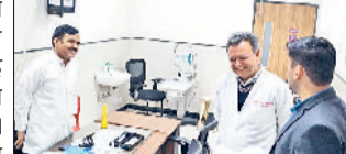
मिवाणी। सोमवार को चिकित्सकों के हड़ताल पर चले जाने की घोषणा के बाद अतिरिक्त उपायुक्त ने सामान्य अस्पताल का निरीक्षण किया। निरीक्षण के दौरान स्वास्थ्य सेवाएं नियमित चलती मिलीं। इस दौरान अधिकारी ने चिकित्सकों की हजिरी जांची। जो चिकित्सक हड़ताल पर मिले, उन चिकित्सकों को सीएमओ ने कारण बताओ नोटिस जारी किया है। अधिकारियों के निरीक्षण की खबर के बाद अस्पताल प्रशासन में हड़कम्प मच गया। दोपहर बाद अतिरिक्त उपायुक्त सामान्य अस्पताल पहुंचे। उन्होंने सबसे पहले चिकित्सकों की हजिरी की जांच की। उसके बाद आपातकालीन विभाग, दवाई व अन्य शाखाओं का निरीक्षण किया। सभी जगह कार्य स्तरोपजनक मिला। उसके बाद अधिकारी ने वहां पर हलाज करवाने आए लोगों से भी बातचीत की और चिकित्सकों व इलाज की भी जानकारी ली। करीब आधे घंटे तक अतिरिक्त उपायुक्त ने अस्पताल की व्यवस्थाओं का जायजा लिया। दूसरी तरफ जो चिकित्सक हड़ताल पर चले गए, उन सभी चिकित्सकों को सीएमओ ने कारण बताओ नोटिस जारी किए हैं।