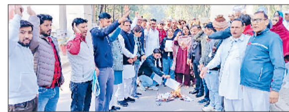
भिवानी। सचिवालय के बाहर प्रतियां फूंकते हुए युवा।

हरियाणा पब्लिक सर्विस कमीशन (एचपीएससी) द्वारा आयोजित अंग्रेजी के लेक्चरर की भर्ती प्रक्रिया विवादों के घेरे में आ गई है। इसी को लेकर सोमवार को स्थानीय लघु सचिवालय के बाहर अभ्यर्थियों का गुस्सा फूट पड़ा तथा भर्ती प्रक्रिया में धांधली और अनियमितताओं का आरोप लगाते हुए अभ्यर्थियों ने